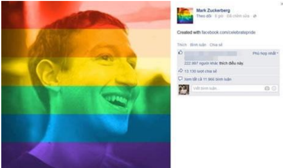
Đồng sáng lập Facebook Mark Zuckerberg trong avatar sắc cờ cầu vồng để ủng hộ người đồng tính.