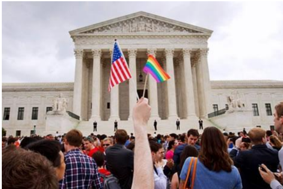
Nhiều người vui mừng trước trụ sở Tối Cao Pháp Viện Hoa Kỳ sau khi phán quyết về đồng tính được phổ biến.