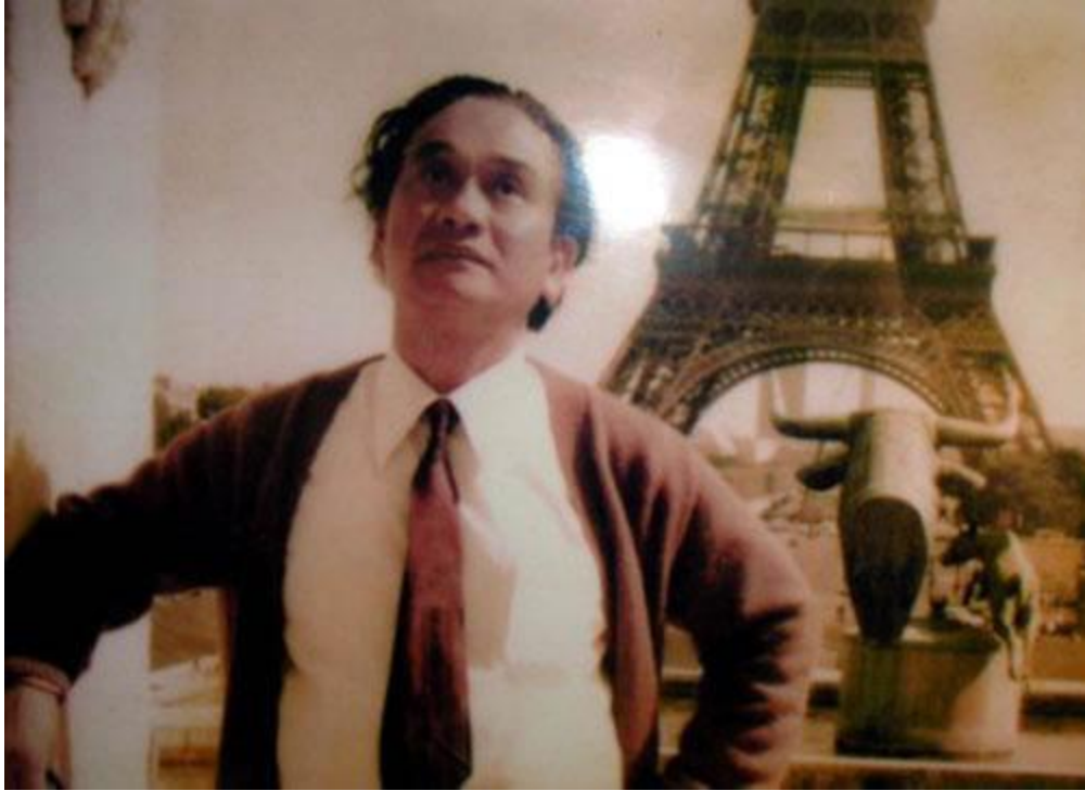
Nhà thơ Xuân Diệu.