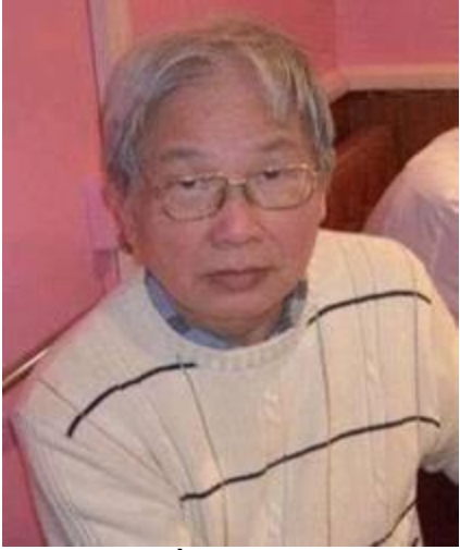
Nhà văn Hồ Trường An