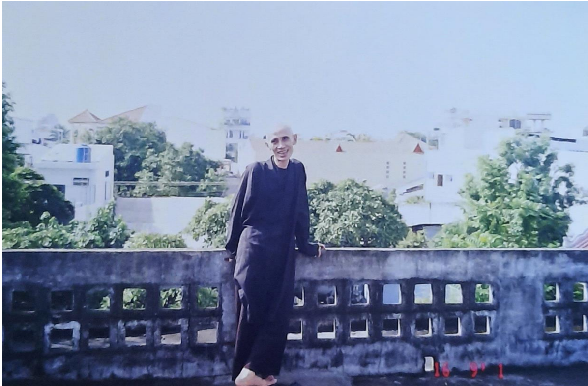
Hòa Thượng Thích Tuệ Sỹ - vị tu sĩ từng lãnh án tử trở thành lãnh đạo GHPGVN Thống Nhất

Khi Hòa Thượng Mãn Giác còn sinh tiền thường nói với chúng tôi: Thầy Tuệ Sỹ và thầy Trí Siêu là 2 viên ngọc kim cương của Phật giáo Việt Nam. Tôi may mắn đã gặp 2 thầy, đã biết về 2 thầy trong những chuyến về Việt Nam của chúng tôi với phái đoàn từ thiện quốc tế. Khi còn ở Việt Nam, chúng tôi không được may mắn quen với 2 thầy, có lẽ chưa đủ cơ duyên, vì lúc làm phóng viên, chúng tôi thường ra chiến trường hơn ở trong thành phố. Mỗi lần về Sài Gòn, chúng tôi thường có mặt mỗi ngày ở tổng y viện Cộng Hòa hay đi thăm các cô nhi viện, thăm hỏi cô nhi quả phụ, thăm các trại gia binh. Thỉnh thoảng, chúng tôi cũng đi chùa vào những ngày lễ lớn như lễ Phật Đản, Vu Lan, Giao Thừa, v.v.