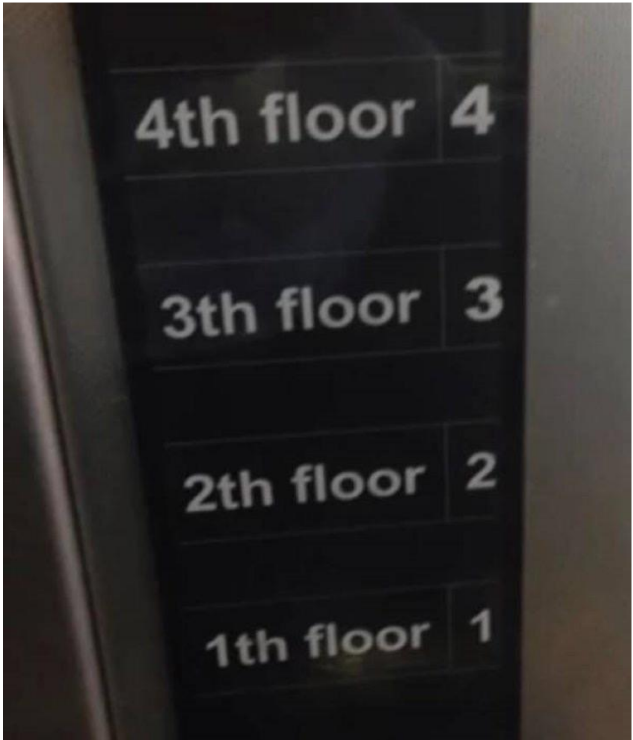
Cái gì đó sai... sai !!