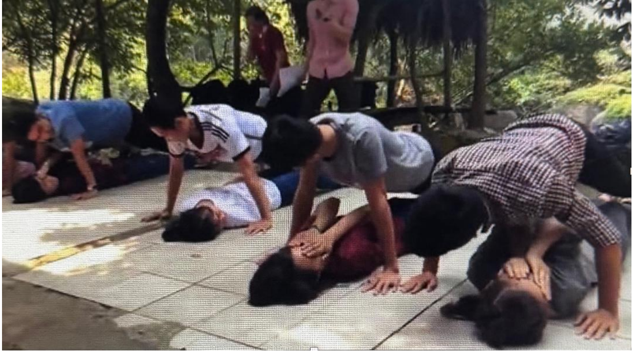
"Hít đất" tập thể.