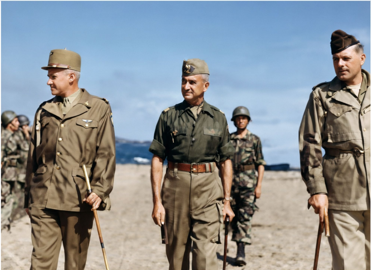
( Các tướng lãnh Pháp thị sát chiến trường Đông Dương )

Văn hóa Pháp, với tôi, mang một vẻ đẹp riêng. Đó là vẻ đẹp của ngôn từ, của âm nhạc, của kiến trúc và của lối sống có trật tự. Những con đường rộng rãi, những công trình bề thế, những trường học được tổ chức bài bản – tất cả đều là dấu ấn của một nền văn minh mà người Pháp mang đến Đông Dương. Là một người từng được thụ hưởng những giá trị ấy, tôi không thể và cũng không muốn phủ nhận chúng.