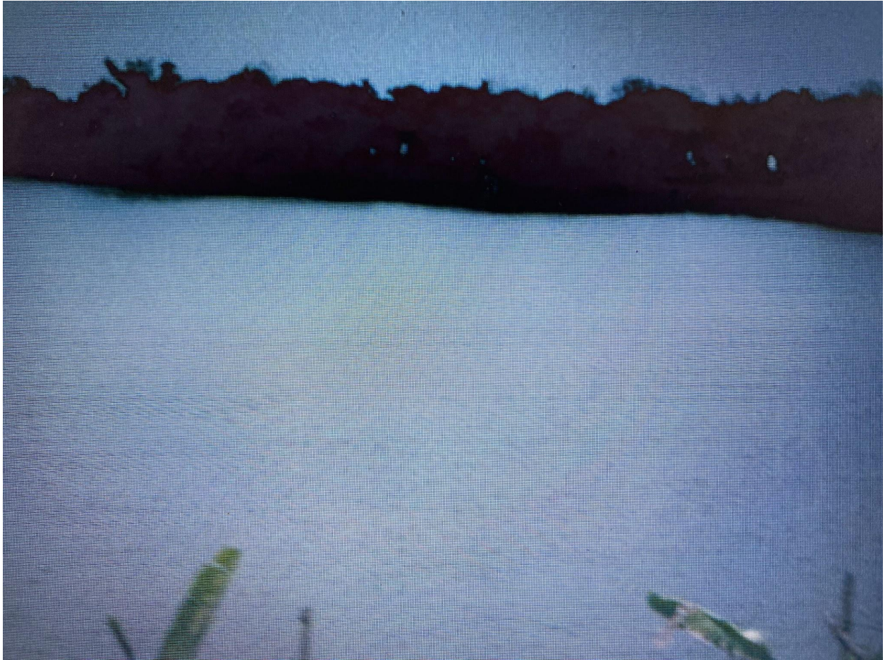
(Sông Châu Giang chảy cạnh nhà)

còn giăng mờ mặt nước, mọi thứ xung quanh như được phủ một lớp khăn mỏng, khiến bước chân tôi chậm lại, vừa đi vừa tò mò ngắm nhìn. Tiếng nước vỗ nhẹ vào bờ, tiếng chim gọi nhau trên cao, tất cả hòa quyện thành một bản nhạc đồng quê rộn ràng, tiễn tôi đi vào một ngày mới.