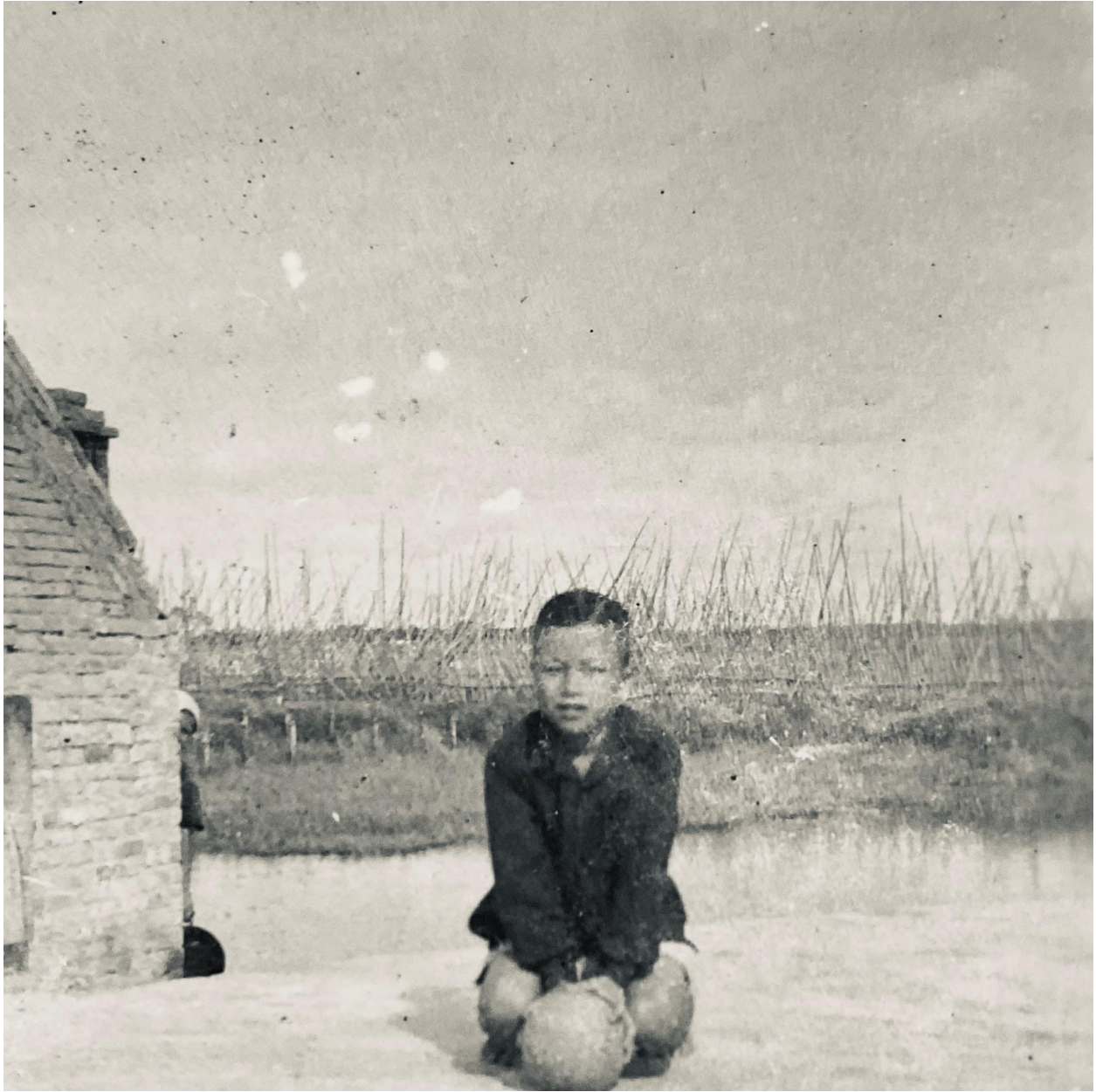
(Hình chụp tại tiền đồn Pháp giữa Nam Định và Ninh Bình, 1949)

Càng lớn lên, tôi càng ý thức rõ hơn rằng cần phải phân biệt giữa con người Pháp và chính sách thực dân Pháp. Con người, như tôi đã thấy và đã trải nghiệm, có thể rất tốt, rất nhân bản, rất đáng quý. Nhưng chính sách thực dân thì khác. Nó được xây dựng trên nền tảng của sự áp đặt, của quyền lực một chiều, của việc tước đoạt quyền tự do và tự quyết của một dân tộc.